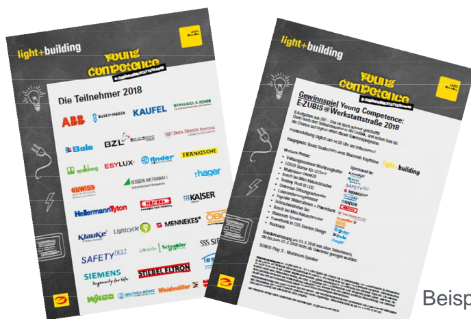
Beispielmedien Light + Building 2018