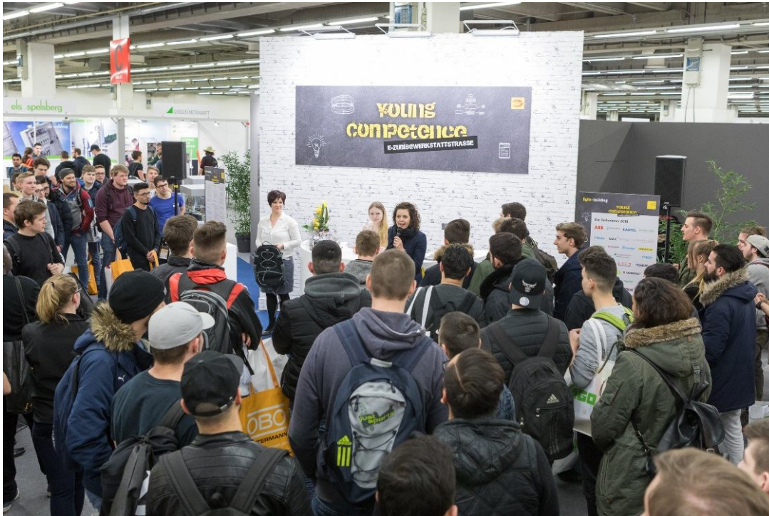
Spannung bei der täglichen Preisverleihung